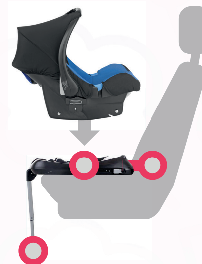
Люлька с опорой